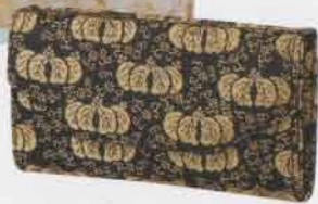
洒脱な手元ークラッチバッグ