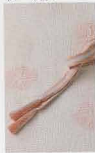
凛とした仕上げー 帯メ・帯揚げ

受け継がれてきた伝統の技と 至高の美を求める心で 織りあげた和装コレクションです。