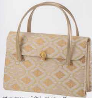
織の気品ー「和」のバッグ