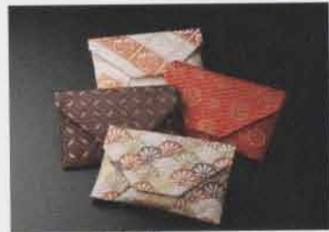
お茶席で一枚寄屋袋