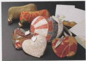
使い方色々ー京染ポーチ