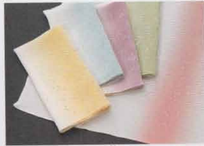
清楚への高品質ー小風呂敷

和装を彩る西陣織の技術を生かし、 平安の雅び、桃山の艶など、 各時代の感性を映した小物の数々。