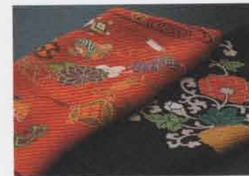
古典の染美ー風呂敷

和装を彩る西陣織の技術を生かし、 平安の雅び、桃山の艶など、 各時代の感性を映した小物の数々。